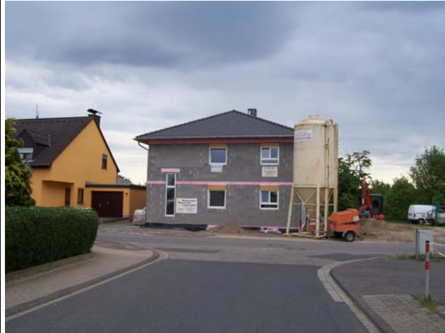
Situation am Anwesen 164/41 (Stand 26.05.2011)

mung vor, so dass keine aktiven Schallschutzmaßnahmen erforderlich werden.